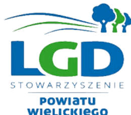
GRAFIKA 1. LOGO STOWARZYSZENIA LOKALNA GRUPA DZIAŁANIA POWIATU WIELICKIEGO

Lokalna Grupa Działania, funkcjonująca pod nazwą „Stowarzyszenie Lokalna Grupa Działania Powiatu Wielickiego” to stowarzyszenie specjalne, posiadające osobowość prawną działające na podstawie przepisów ustawy z dnia 20 lutego 2015 r. o rozwoju lokalnym z udziałem lokalnej społeczności (Dz.U. 2015 poz. 378). Stowarzyszenie Lokalnej Grupy Działania Powiatu Wielickiego ma na celu działanie na rzecz rozwoju obszarów wiejskich na terenie Gminy Wieliczka, Gminy Niepołomice oraz Gminy Kłaj.